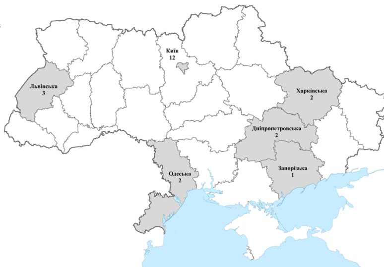
Рисунок 9. «Перелік підприємств, установ, організацій, господарська діяльність яких аналізується Комісією»

Для аналізу ефективності використання бюджетних коштів за відповідними програмами, виявлення можливих порушень бюджетної дисципліни та підготовки пропозицій щодо удосконалення державної політики у сфері культури Комісія звернулась до цих 22 інституцій щодо надання інформації про виконання бюджетних програм «Фінансова підтримка національних художніх колективів, концертних організацій та їх дирекцій, національних і державних циркових організацій» та «Фінансова підтримка національних театрів» за 2021–2025 роки з поданням копій паспортів цих програм (із зазначенням КПКВК, головних розпорядників коштів, затверджених обсягів фінансування та результативних показників), а також фінансових звітів, установчих і кадрових документів, відомостей про платні послуги, орендні