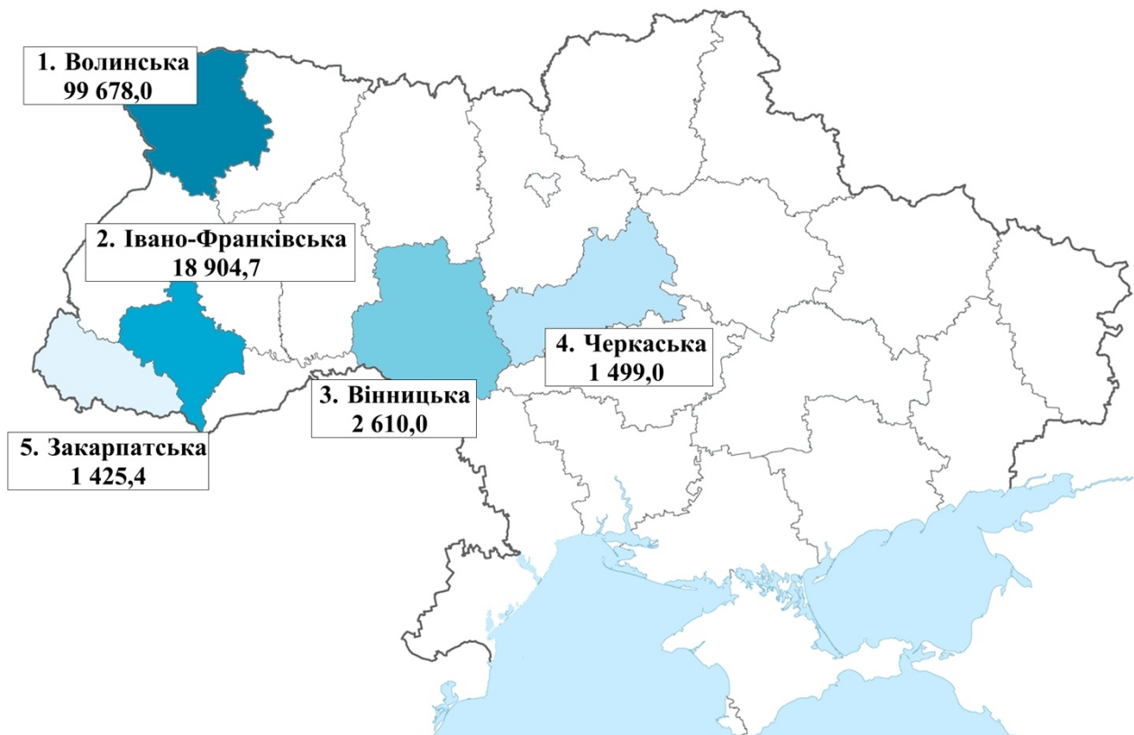
Рисунок 3. “Топ-5 регіонів за 2025 р. за обсягом міжнародної технічної допомоги, залученої для розвитку туризму у 2025 році, (тис. грн.)”

У 2025 році лідером стала Івано-Франківська область, яка залучила 2,60 млн грн. Тоді як Черкаська отримала лише 1,49 млн. грн, а Закарпатська – 1,42 млн. грн.