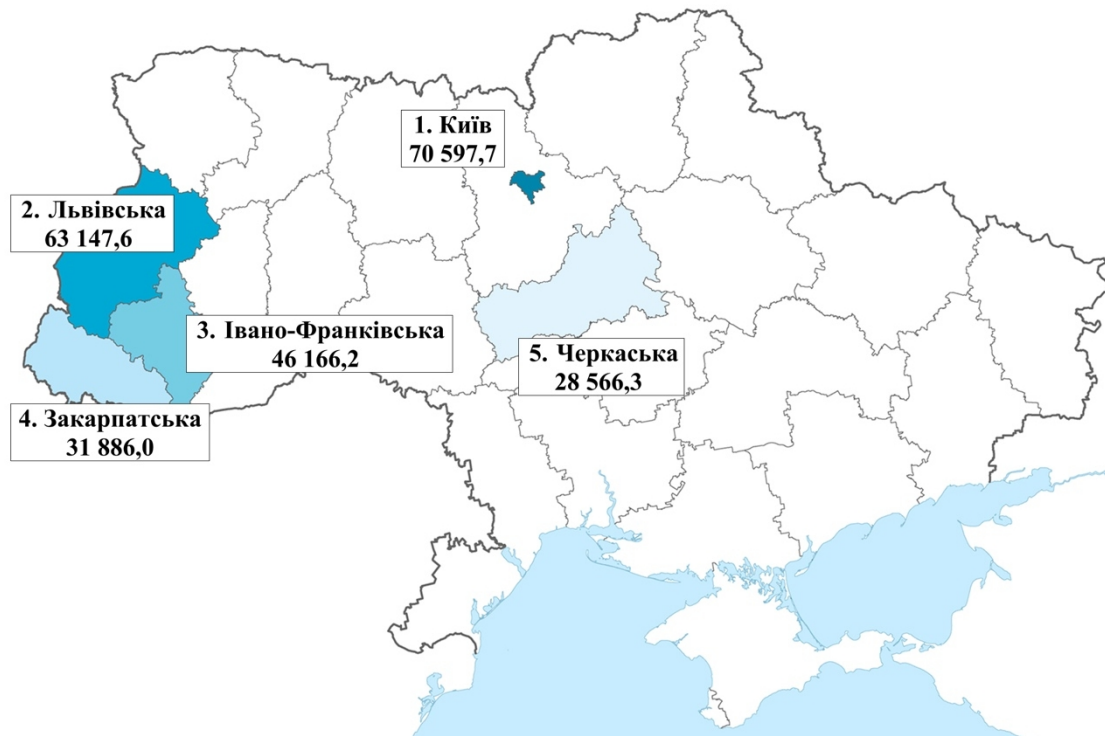
Рисунок 2. “Топ-5 регіонів за 2025 р. за сумою туристичного збору (тис. грн.)”

Водночас ДАРТ констатує значне падіння у східних і південних регіонах – Харківській, Донецькій, Луганській та Херсонській областях, що зумовлено активними бойовими діями та відсутністю туристичної активності.