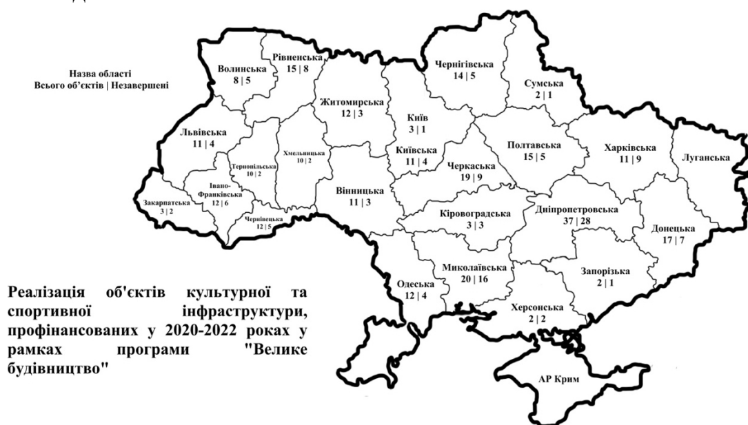
Рисунок 6. "Реалізація об'єктів культурної та спортивної інфраструктури у рамках програми "Велике будівництво"

Зазначена норма діяла впродовж 2022 року, тому розпорядники коштів мали змогу спрямувати залишки субвенцій, окрім цільового їх призначення, і на зазначені заходи.