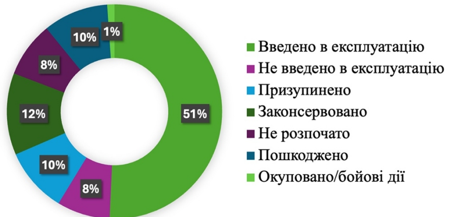
Рисунок 5. “ Стан реалізації програми “Велике будівництво”

Згідно наданої інформації загальна кількість запланованих об’єктів в розрізі України становить 272, з яких 132 є незавершеними.