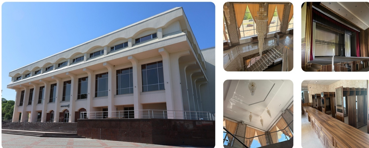
Рисунок 7. “Фотографії об'єкта незавершеного будівництва - Шевченківський культурний центр («Шевченко НУВ») у м. Канів”