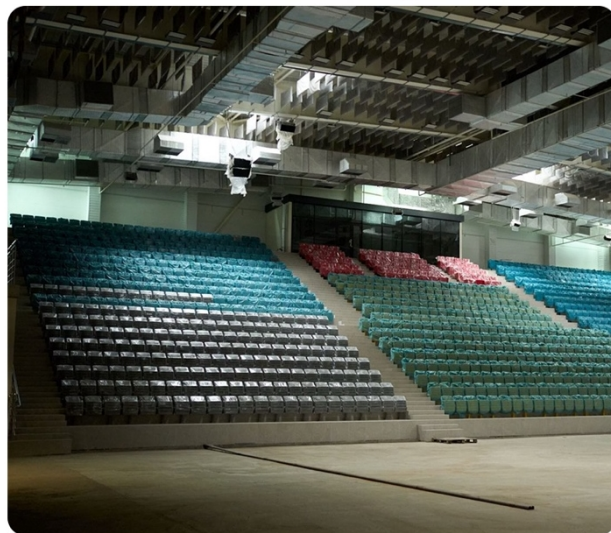
Рисунок 8. “Фотографії об'єкта незавершеного будівництва - Палацу спорту по вул. Прибузькій, 5/1А у м. Хмельницький”

Об'єкт має стратегічне значення для розвитку спортивної інфраструктури регіону, проте внаслідок тривалого недофінансування існує ризик втрати вже реалізованого обсягу робіт. Для завершення будівництва необхідно додатково 154,66 млн грн (у цінах 2021 року). Відзначено також, що проєктно-кошторисна документація наразі перебуває на етапі коригування відповідно до чинних будівельних норм. Учасники візиту наголосили на важливості забезпечення належного технічного стану об'єкта до моменту відновлення фінансування та завершення будівельних робіт, а також на потребі актуалізації вартості завершення будівництва.