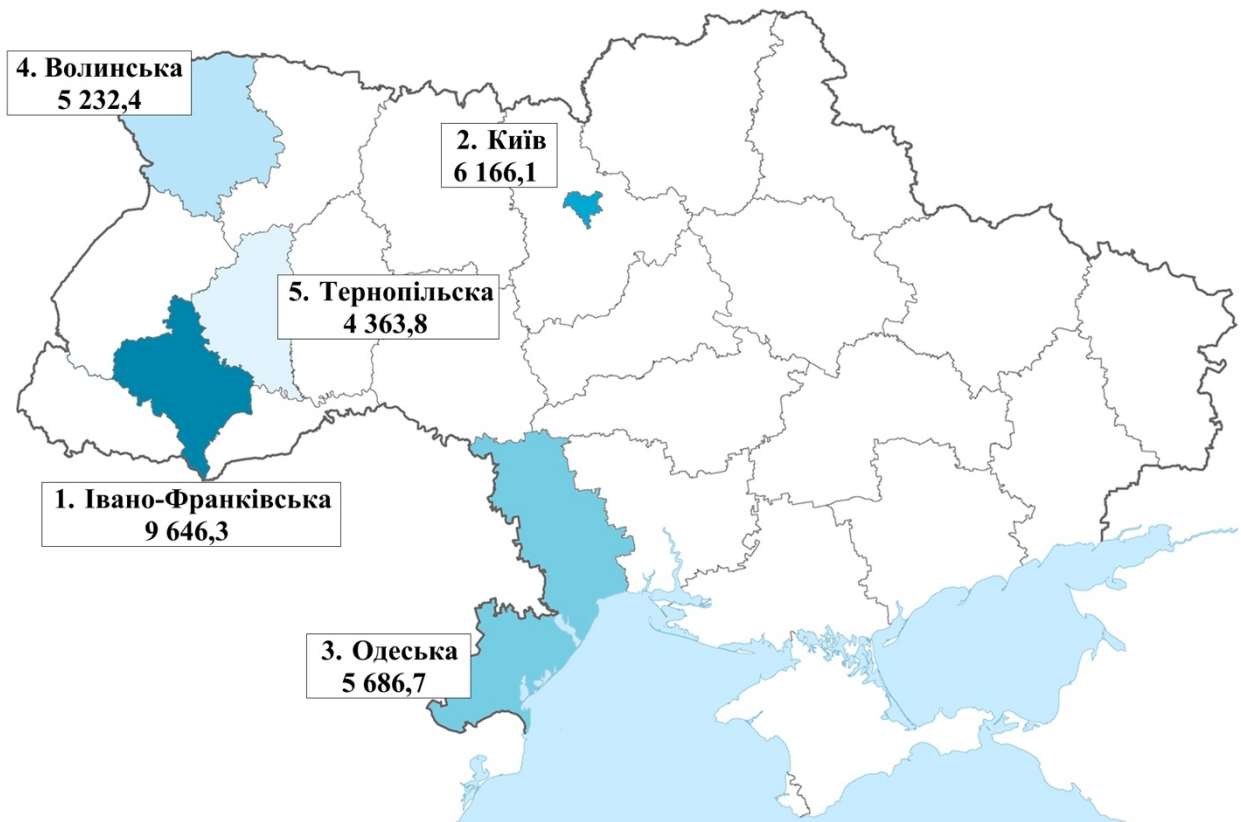
Рисунок 4. “Топ-5 регіонів за 2025 р. за обсягом грошових коштів, виділених з місцевого бюджету на розвиток туризму у 2025 році (тис. грн.)”

Фінансування з місцевих бюджетів на розвиток туризму також збільшилося - з 29 млн грн у 2024 році до 54,89 млн грн у 2025 році. Найбільші видатки спостерігаються в Івано-Франківській області (9,64 млн грн) та місті Київ (6,16 млн грн).